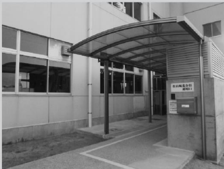
松山城北分校入口